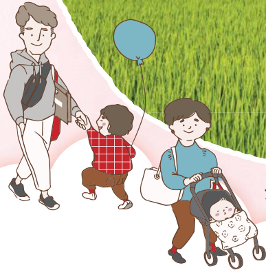
シェルターインクルーシブプレイス コパル